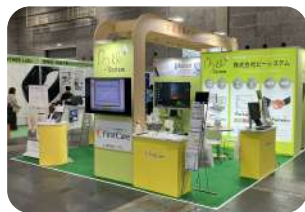
↑ 昨年11月に行われた ケアテックス大阪2023の風景