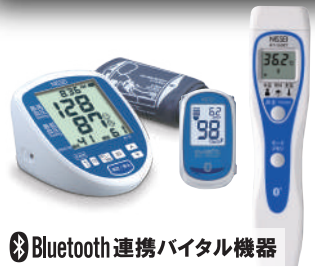
Bluetooth連携バイタル機器

訪問記録はタップするだけ！バイタル記録も簡単に取ることができます。連携するバイタル機器を使えば測定値を自動で反映します。