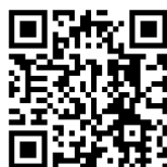
宛名ラベル(居宅版)