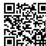
宛名ラベル(施設版)