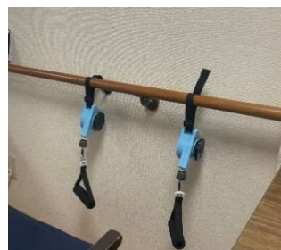
実際に手すりに設置している様子

【ぷるそら】はコンパクトな商品となっておりますので、設置場所に困ることはありません。多くの施設に設置されている「手すり」にも簡単に取り付けることが可能となっています。