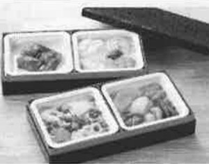
▶販売3年目となる「正月」二段重セット

イーエヌ大塚製菓(岩 手県花巻市)は授食回復 支援食「あい」とのお せち料理「正月」二段重セ ット」を1500セット 限定で販売する。受付期 間は10月27日～11月30 日まで。 新年の門出を祝う「正 月」二段重セット」は20 12年の発売以来、今年 で3回目。メニューは牛 肉の大豆煮・海苔蒸し・ ちらし寿司・大豆と野菜 の煮しめの4種類。 「あい」とは通常の 食事を摂ることが難しい 人の食べる機能と栄養状 態の回復を支援するため の食事(冷凍食品)で、 独自の技術により食材本 来の形、色、味、栄養素 を保ちながら舌で崩すこ とのできるやわらかさに 仕上げている。3食で9 50～1300キロカロ リーのエネルギーを無理 なく摂取できる設計にな っており、調理の手軽さ も売りの商品。